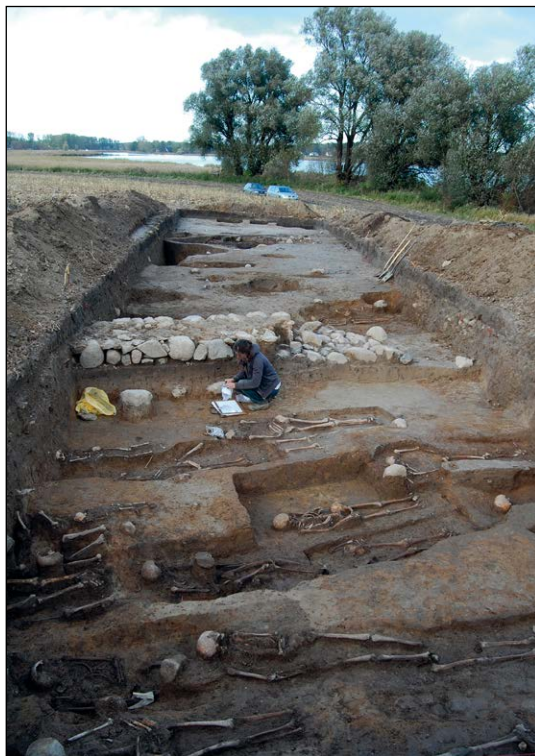
Ryc. 3. Grobia, badania archeologiczne w 2010 r.: Fundamenty kościoła i pochówki.