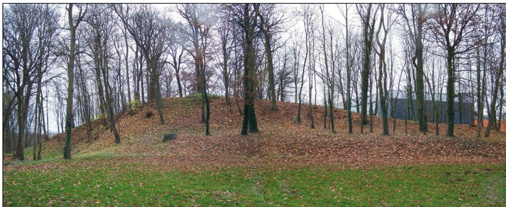
Ryc. 9. Trzebiatów nad Tolężą. Widok na „Górę Klasztorną”, miejsce założonego w latach 1191-1194 klasztoru.