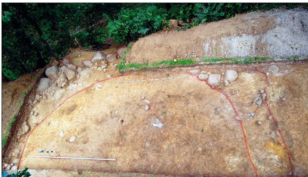
Ryc. 10. Apsyda kościoła klasztornej na „Górze Klasztornej” w Altentreptow, badania archeologiczne z 2009 r. Fundament i negatyw muru fundamentowego zaznaczono na czerwono.