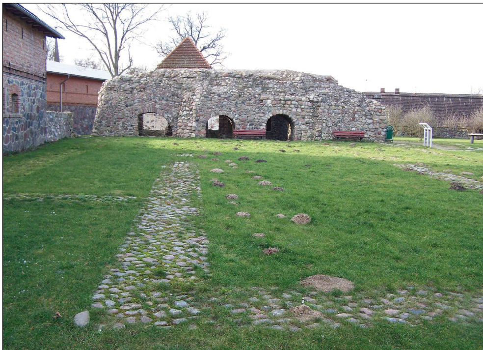
Ryc. 5. Relikty kościoła klasztornego w Stolpiu (Stolpe) nad Pianą.