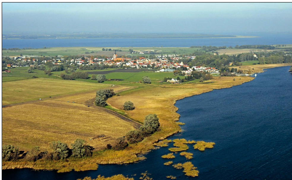
Ryc. 4. Grobia, widok na półwysep klasztorny (z wykopami z 2010 r.), na miasto Uznam i wczesnośredniowieczne grodzisko „Bauhof“ (po prawej stronie miasta).