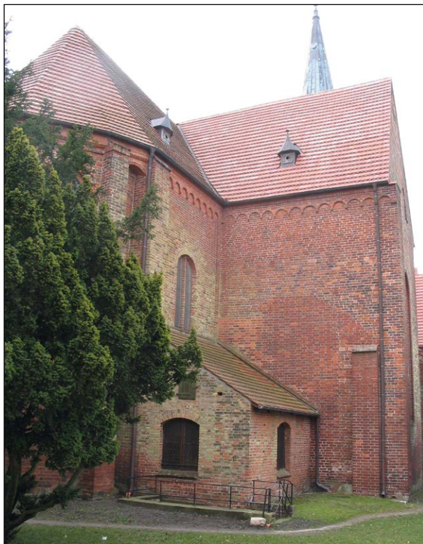
Ryc. 11. Kościół w Bergen na Rugii.