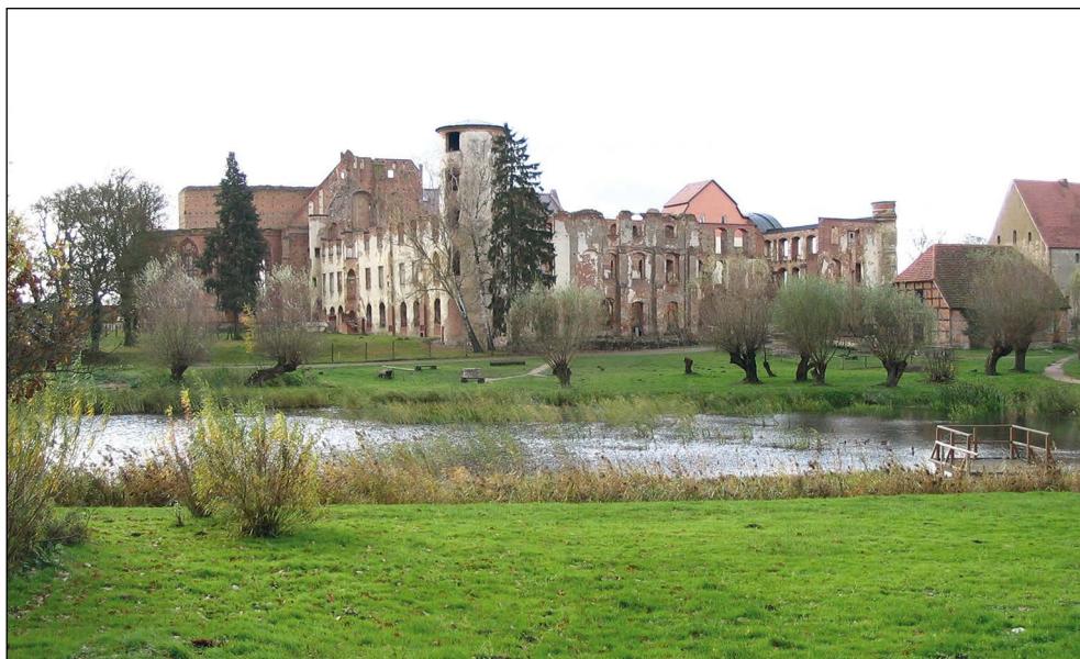
Ryc. 12. Relikty kościoła i zamku w Dargun.