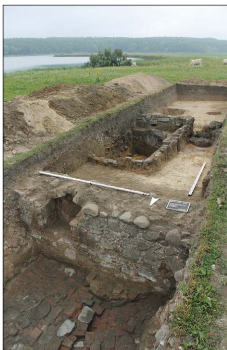
Ryc. 8. Seehausen, skrzydło południowe klauzury z piwnicą i instalacją ogrzewania, badania archeologiczne z 2012 r.