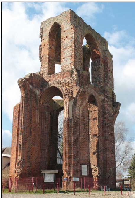
Ryc. 7. Ruina kościoła w Gramzow.