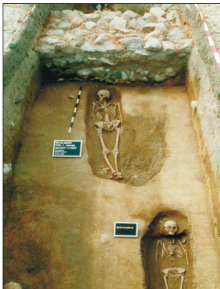
Ryc. 2. Fundamenty klasztoru i fragment cmentarza w Grobie (Grobe) w trakcie badań z 1997 r.